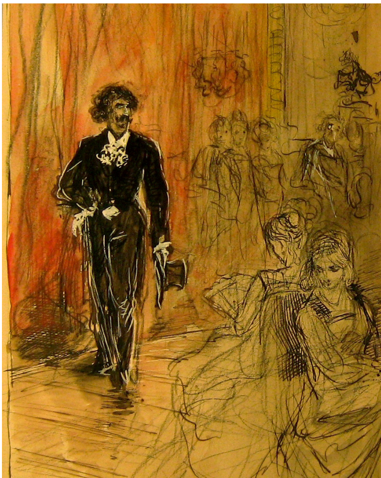
Félix Buhot, illustration préparatoire pour le roman "Une Vieille maîtresse"