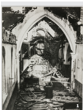
1. L'église de Saussemesnil après le dynamitage du 9 juin 1944